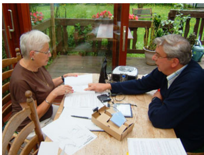
Formation au numérique

Tous les trois mois, l'équipe de volontaires, épaulée par son Président, réalise un « Journal sonore ». Dans les rubriques de ce journal trimestriel, (constitué de lectures, recettes de cuisine, concours, ...) se trouve une fenêtre ouverte aux questions/réponses des auditeurs : elle permet de créer une interaction entre les membres, et donc de les sortir de leur isolement.