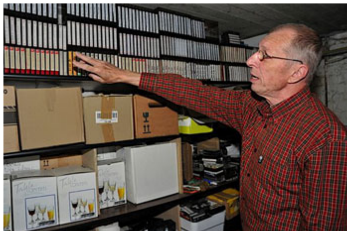
Archives journaux sonores