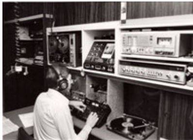
Studio "Plantin" en 1975, 20 ans après la création (bandes magnétiques et cassettes audio)

Le Club Magnétique permet aux aveugles, malvoyants, seniors et isolés de communiquer, lire et se distraire par CD et cassettes audio. Les membres viennent de Belgique, bien sûr, mais aussi de France, de Suisse, d'Algérie et même du Texas! Moyennant une petite cotisation, ils ont à leur disposition une sonothèque de plus de 4000 heures d'écoute. C'est cette cotisation, et rien qu'elle, qui permet au Club de fonctionner. Les dons sont évidemment très appréciés car le système d'envoi, ainsi que son support administratif, demande un investissement important (achat des CD's, des enveloppes étanches, des graveurs CD, etc.).