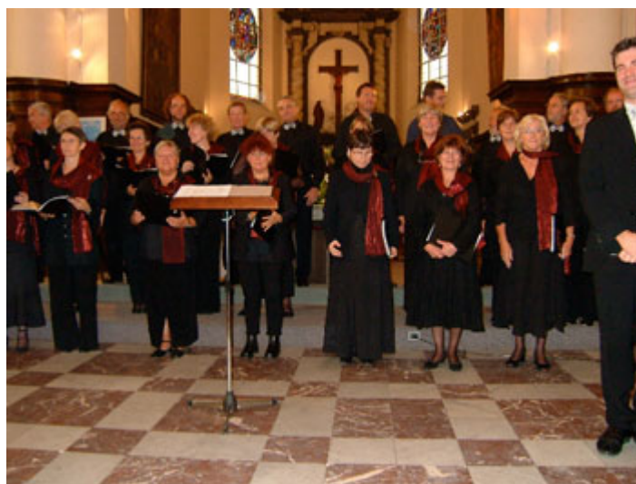
Concert "La Poutre"/ "Le petit Ryton" organisé le 2 juin 2007 en faveur du Club Magnétique