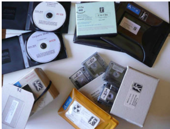
Supports Club Magnétique

Michel Senel, le fondateur du Club, est entouré de 27 merveilleux bénévoles, qui réalisent des tâches très variées comme l'enregistrement des récits, la duplication des cassettes ou CD's, l'envoi des titres aux membres, le montage sonore, etc. Les volontaires effectuent toutes ces tâches gracieusement, sans aucune rémunération. Par ailleurs, l'asbl ne compte aucun travailleur salarié.